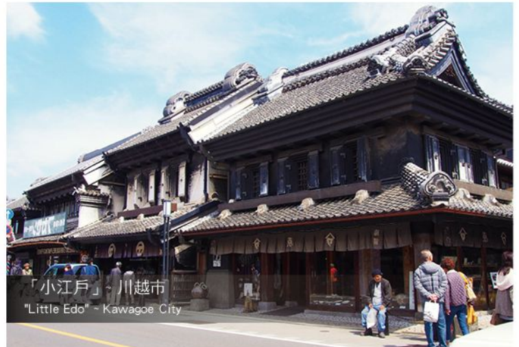
「小江戸」~ 川越市 "Little Edo" ~ Kawagoe City