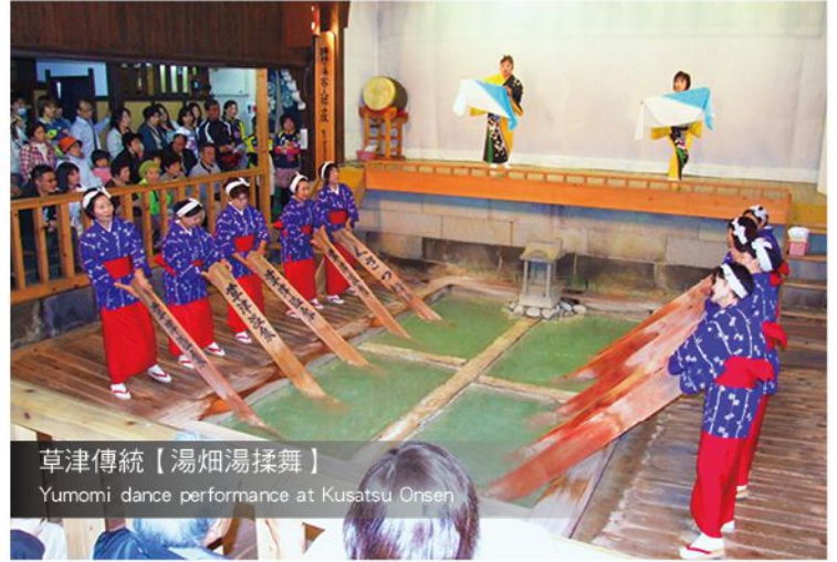
草津傳統【湯畑湯揉舞】 Yumomi dance performance at Kusatsu Onsen

高崎・少林山達摩寺→「小江戸」~ 川越市→免稅店→東京晴空塔 Shorinzan Darumaji Temple → "Little Edo" ~ Kawagoe City → Duty Free Shop → Tokyo Skytree CANDEO hotel chain or similar